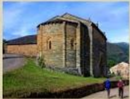
Iglesia de Santiago en Villafraanca del Bierzo, León (románica)

En la plenitud de la Baja Edad Media, las peregrinaciones a Santiago contribuyeron a fortalecer las rutas comerciales y políticas entre los reinos de la cristiandad. También atrajo a artistas europeos que desarrollaron la arquitectura románica, gótica y barroca, entre otras.