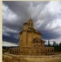
Santa María de Eunate, Navarra (románica)