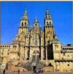
Catedral de Santiago (románico-barroco-gótico)