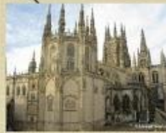
Catedral de Burgos (gótico)