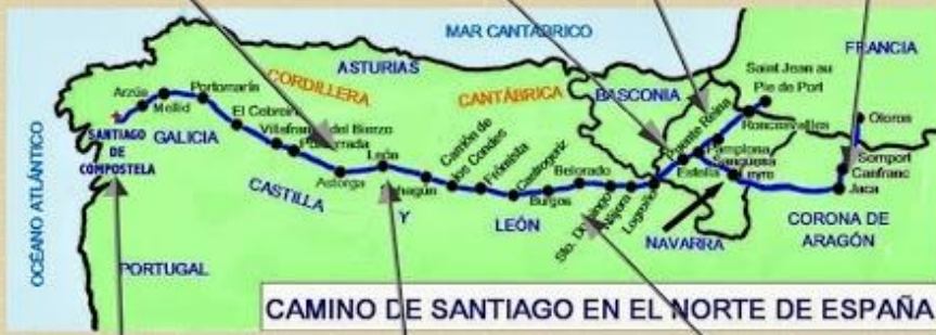
CAMINO DE SANTIAGO EN EL NORTE DE ESPAÑA