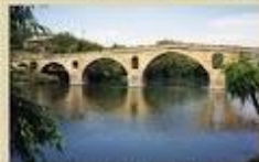
Puente de la Reina, Navarra (románica)