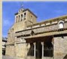
Catedral de Jaca (románica)