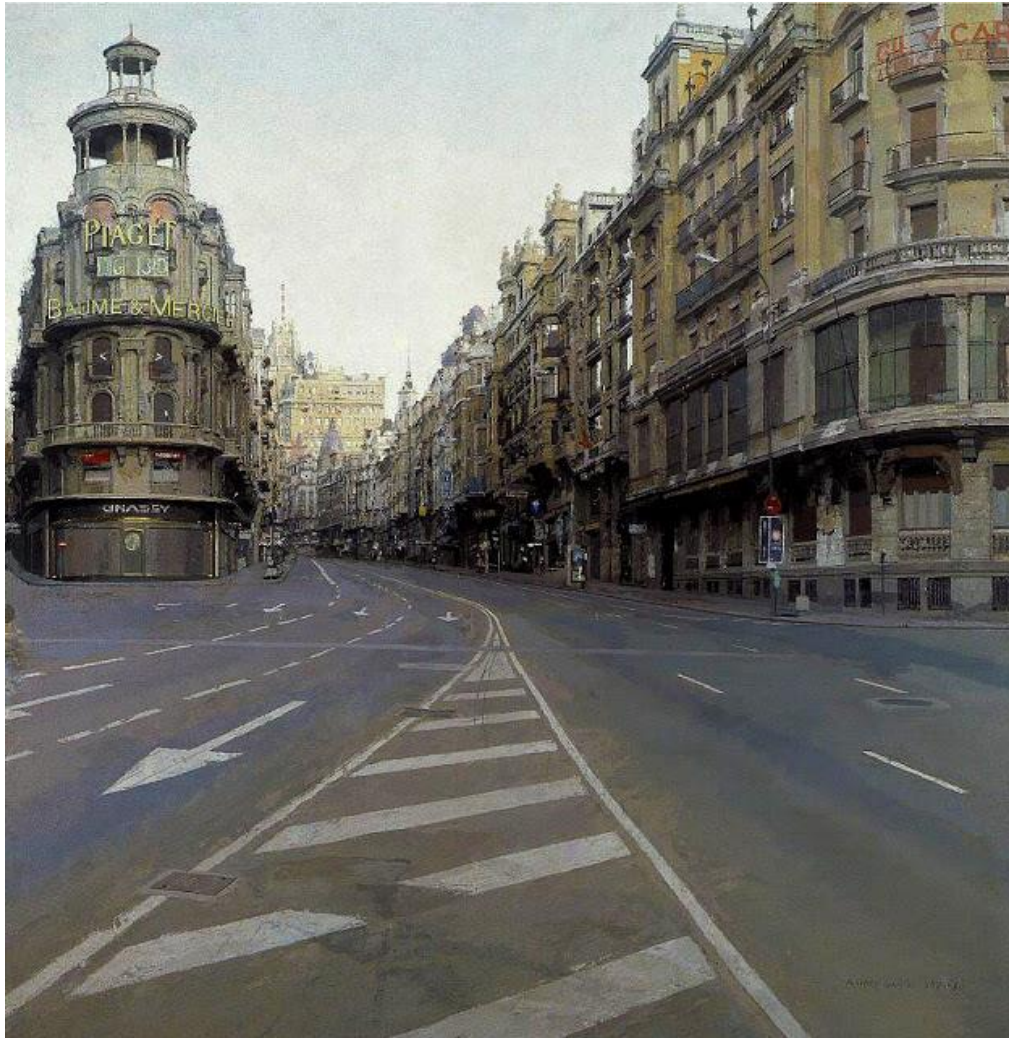
ANTONIO LÓPEZ: LA GRAN VÍA (1974)