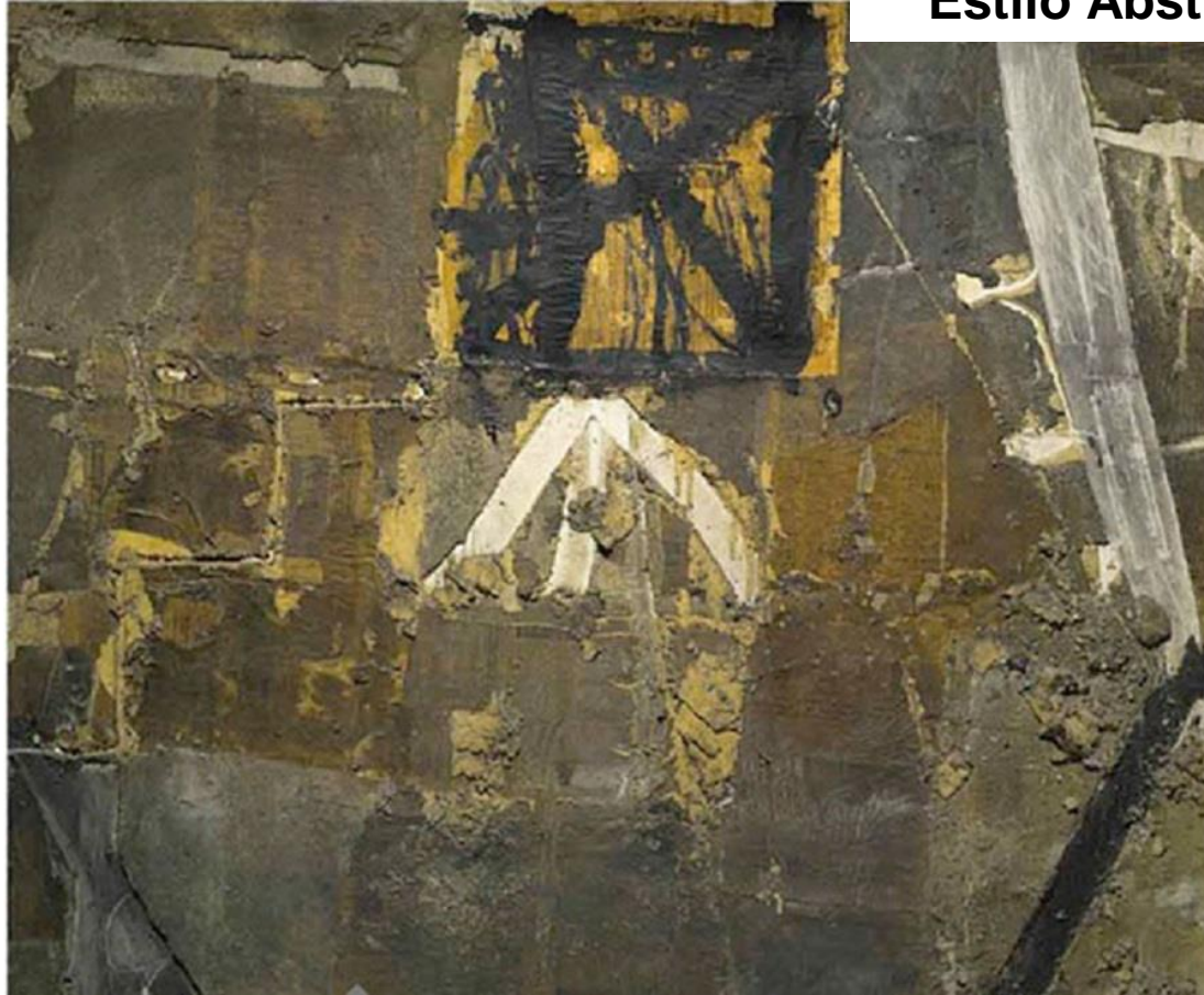
ANTONI TAPIES: MATERIA SOBRE TELA Y COLLAGE DE PAPEL (1964).