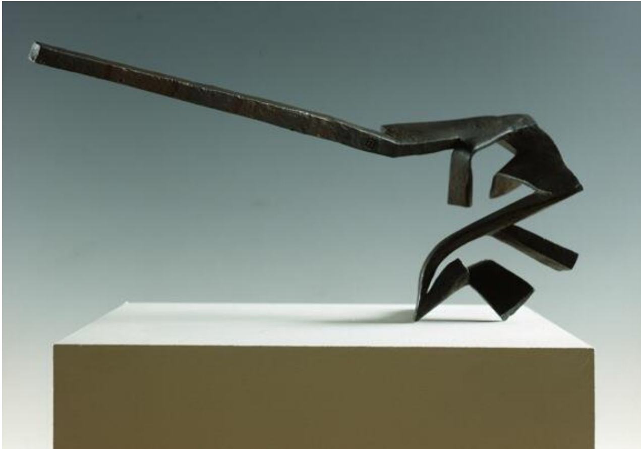
EDUARDO CHILLIDA: HIERROS DE TEMBLOR (1956)