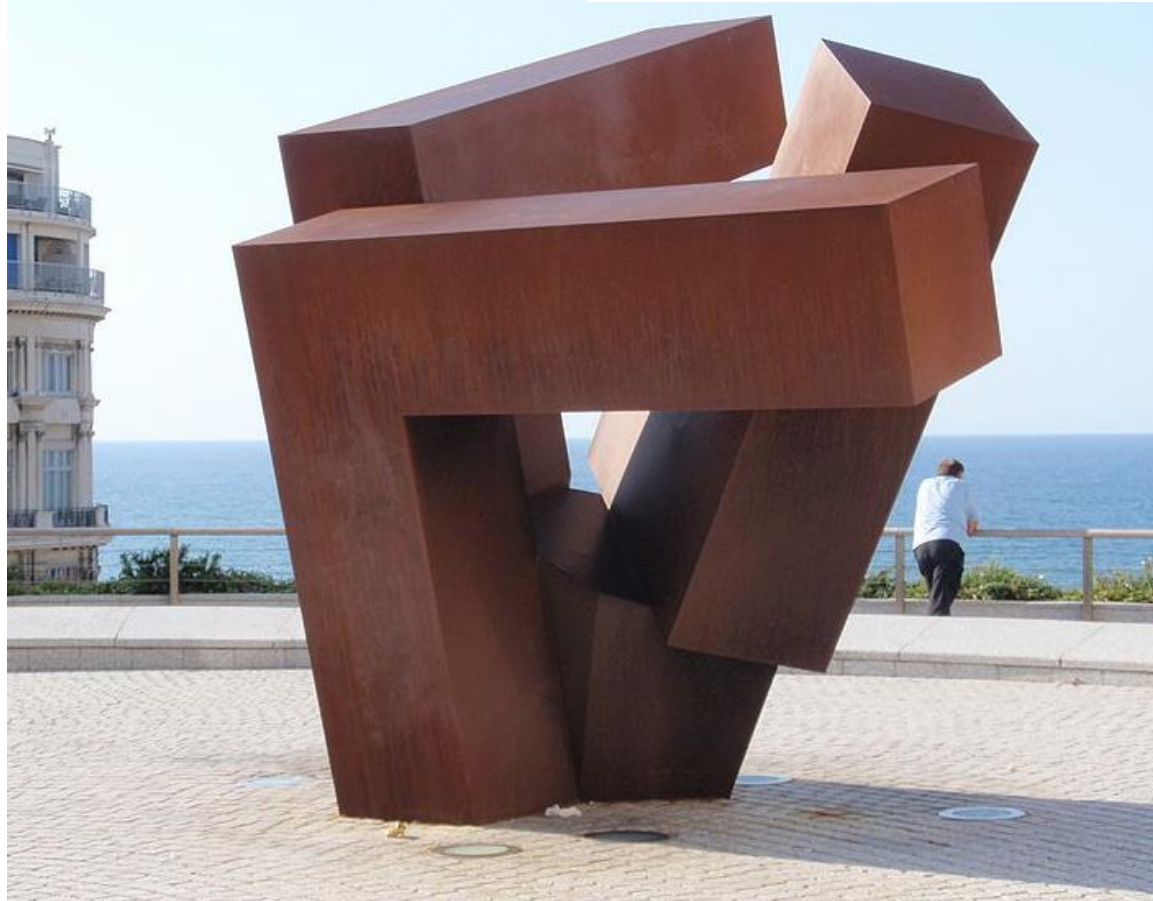
JORGE OTEIZA: HOMENAJE AL CASERÍO VASCO