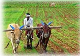
Tradicional (Animales y trabajo manual)