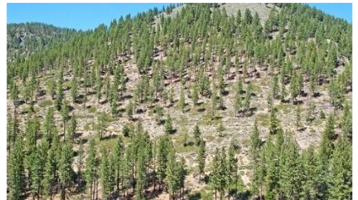
Planes de Reforestación y protección de espacios naturales ( pinares)