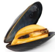
Mejillón, almeja y ostra (crustáceos)