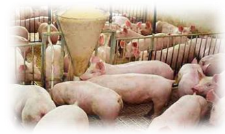
Intensiva (Agricultura y ganadería): Alta productividad