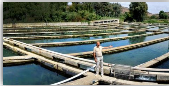
Acuicultura agua dulce