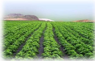
Cultivos de regadío (aporte extra de agua): frutales y hortalizas