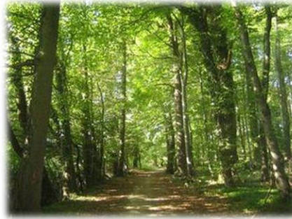
Bosques de frondosas (roble, haya, encina)