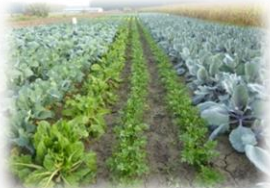
Policultivo (varios cultivos). Agricultura mediterránea de huerta