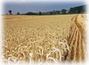
Cultivos de secano (solo lluvia): Tríada mediterránea (cereal, vid y olivo)