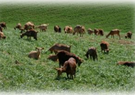
Extensiva (Agricultura y ganadería): Baja productividad