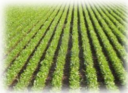
Monocultivo (un cultivo): Agricultura de plantación