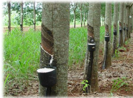
Caucho natural (Hevea, árbol del Amazonas)