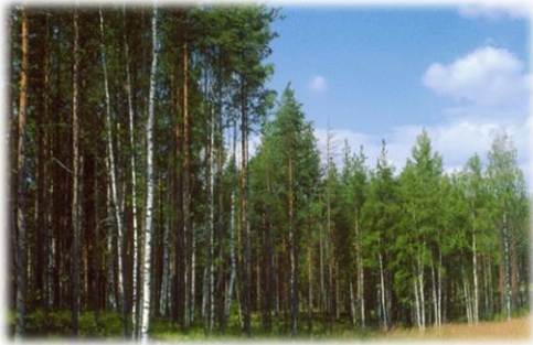
Bosques de coníferas (abetos, pinos, cedros)