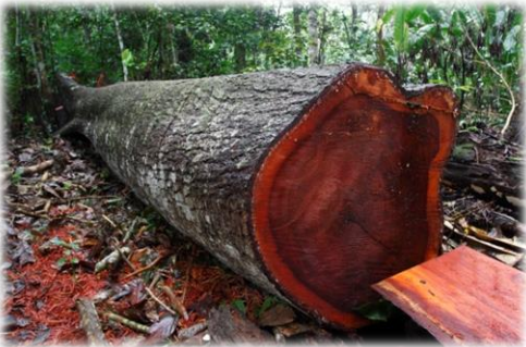
Maderas preciosas del bosque tropical (caoba, ébano, teca...)