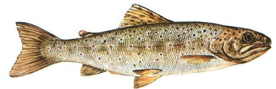
Trucha (peces de agua dulce)