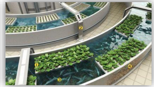
Acuaponia (cultivo de algas)

Ventajas principales: alta producción y variada, sin restricciones (sin cuotas pesqueras impuestas por la PPC de la UE), no agota caladeros y de precios asequibles.