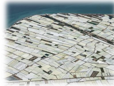
Mar de plástico (Invernaderos)